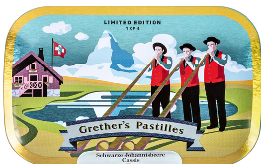
Tre uomini suonano la preghiera serale con il corno alpino; sullo sfondo il panorama del Cervino.