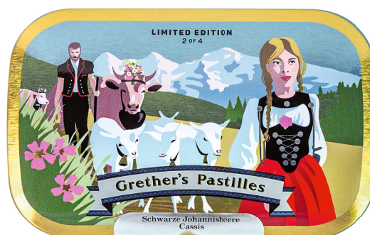
Salita all'alpeggio nell'Oberland bernese; con la celebre catena montuosa Eiger-Mönch-Jungfrau sullo sfondo.