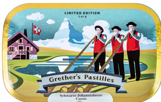
Alphorn-Trio beim abendlichen Betruf vor dem Panorama des Matterhorns.

Die Darstellungen wurden von der Basler Illustratorin Patrizia Stalder gefertigt. Mit ihren Porträts schaffte sie es bereits in die Publikation «200 Best Illustrators Worldwide 18/19» des renommierten Lürzer's Archive. Patrizia Stalder sagt zum Projekt: «Das Besondere war, den traditionellen Sujets einen eigenen Stil zu geben.» Entstanden ist eine Hommage an die Schweiz.