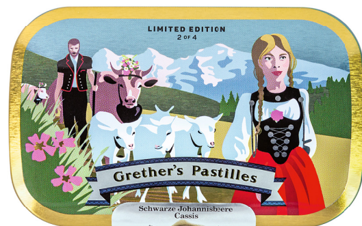
Alpaufzug im Berner Oberland vor der berühmten Gebirgskette Eiger, Mönch und Jungfrau.